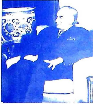
پاکستان جو پروفار وزير اعظم