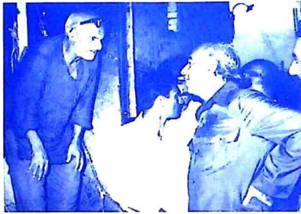
شهيد ڀٽو هڪ پورهيت سان حال اوريندي