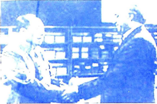
شهيد ذوالفقار علي ڀٽو ۽ چين جو عظيم اڳواڻ ماو زي تنگ هڪ ٻئي سان هٿ ملائيندي