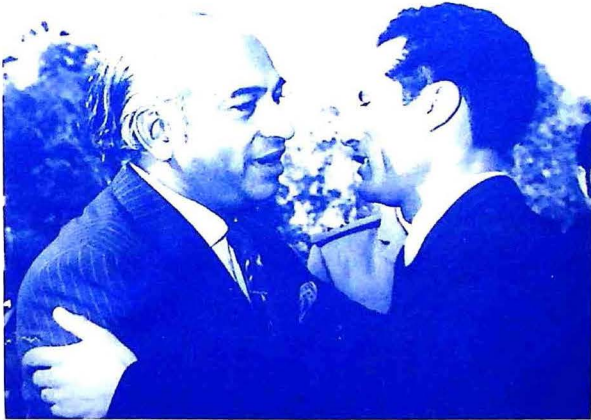
ٻه دوست: شهيد ذوالفقار علي ڀٽو ۽ ليبيا جو اڳوڻو انقلابي رهنما ڪرنل قذافي