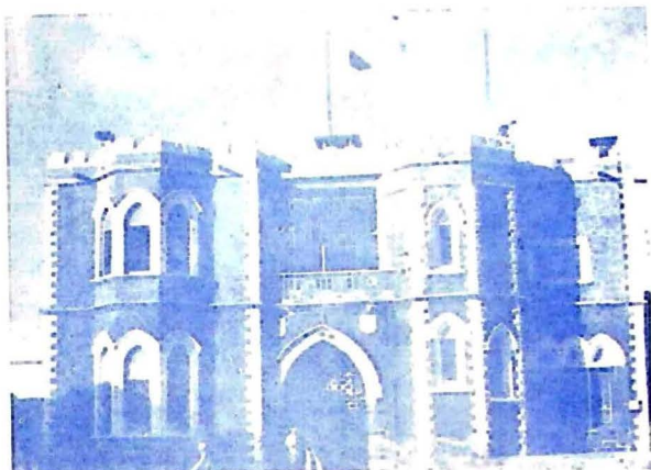
سينٽرل جيل راولپنڊي، جتي شهيد ذوالفقار علي ڀٽو کي قاسميءَ ڇاڙهيو ويو