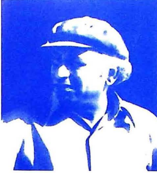
شهيد ڀٽو ماڻو ڪيپ ۾