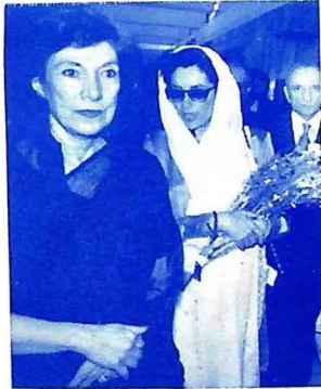
بيگم نصرت ڀٽو ۽ محترم بينظير ڀٽو پهرين حڪومت سنڀالڻ وقت