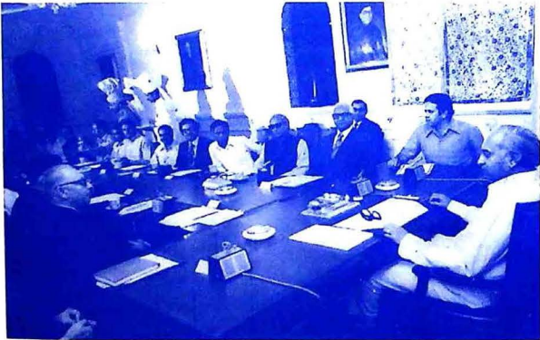
شهيد ڀٽو پنهنجي عوامي حڪومت دور ۾ وزارتِي گڏجاڻيءَ جي صدارت ڪندي