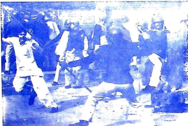
آمر ضياءَ جي آمريت خلاف احتجاج ڪندڙن مٿان پوليس جي لٽبازي (فوٽو: ۱۹۸۷ع)