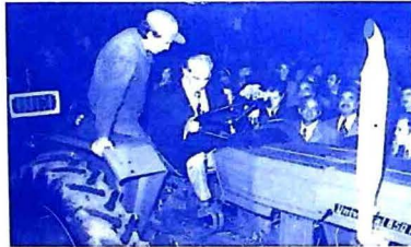
شهيد ڀٽو پنهنجي حڪومت دور ۾ زرعي سڌارن تي عمل دروان ٽريڪٽر اسڪيم جو افتتاح ڪندي