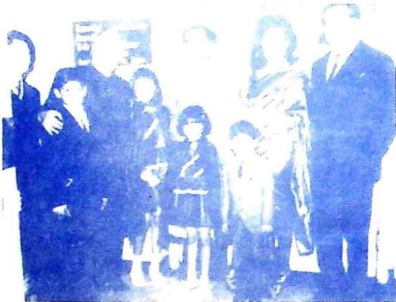
شهيد ڀٽوءَ بيگم نصرت ڀٽو چين جي انقلابي رهنما چواين لاءِ سان. ساٿن گڏ بينل ٻار: بينظير ڀٽو مير مرتضيٰ ڀٽو شاهنواز ڀٽو ۽ صنم ڀٽو