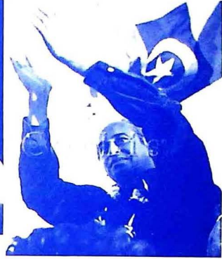
شهيد ذوالفقار علي ڀٽو 1967ع ۾ وزير خارجہ جي عهدي تان استعفيٰ ڏيڻ کانپوءِ پاڪستان پيپلز پارٽي جو اعلان ڪندي