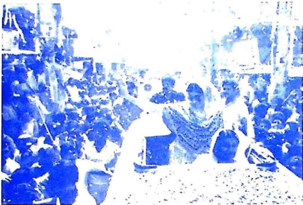
محترمہ بینظیر ڀٽو ۱۹۸۶ع ۾ جلاوطنيءَ کان پوءِ وطن ورتڻ تي استقبال لاءِ آيل عوام کي پليڪار ڪندي