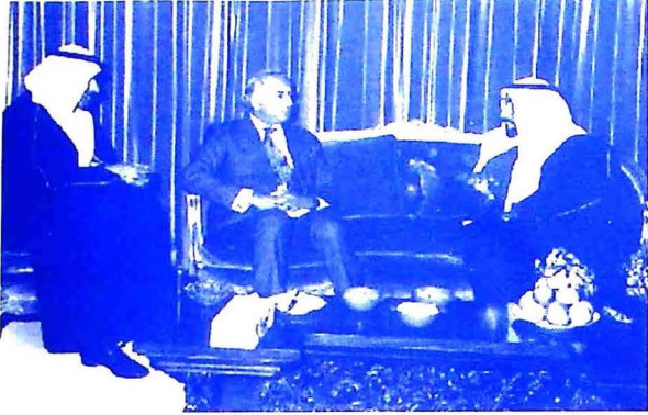
شهيد ڀٽو پنهنجي حڪومتي دور ۾ گڏيل عرب عمارات جي سربراھ شيخ زيد بن سلطان النهيان سان گڏجاڻي ڪندي