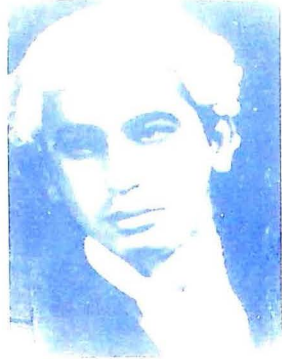
شهيد فوهر جوانيءَ وارن ڏينهن ۾