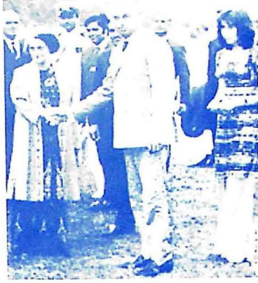
جناب ذوالفقار ڀٽو (شهيد) ۽ مسز اندرا گانڌي (شهيد) پاڻ ۾ هٿ ملائيندي ۽ شهيد ڀٽي جي پر ۾ رينل محترم بينظير ڀٽو (شهيد) (فوتو: 1972ع هندستان)