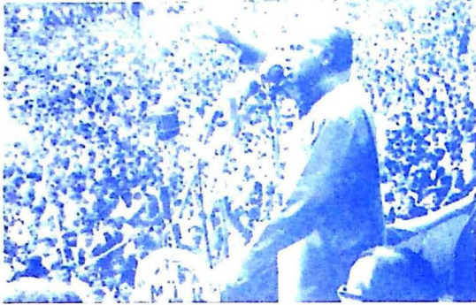
قائد عوام شهيد ذوالفقار علي ڀٽو عوام کي خطاب ڪندي