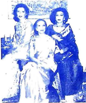
محترمہ بينظير ڀٽو، سندس والده بيگم نصرت ڀٽو ۽ صنم ڀٽو. جڏهن ضياءَ دور ۾ محترمہ کي پيڻ جي شاديءَ تي وقتي آزاد ڪيو ويو