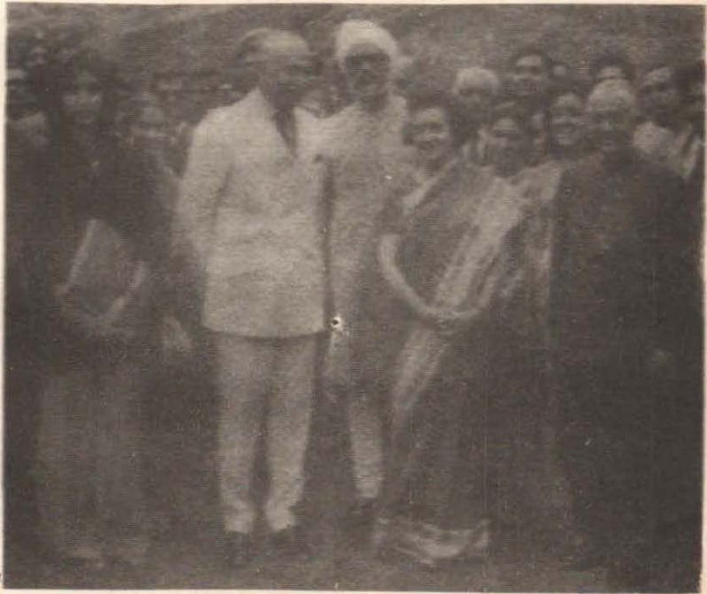
ذوالفقار علي ڀٽو هندستان جي وزيراعظم اندرا گانڌيءَ