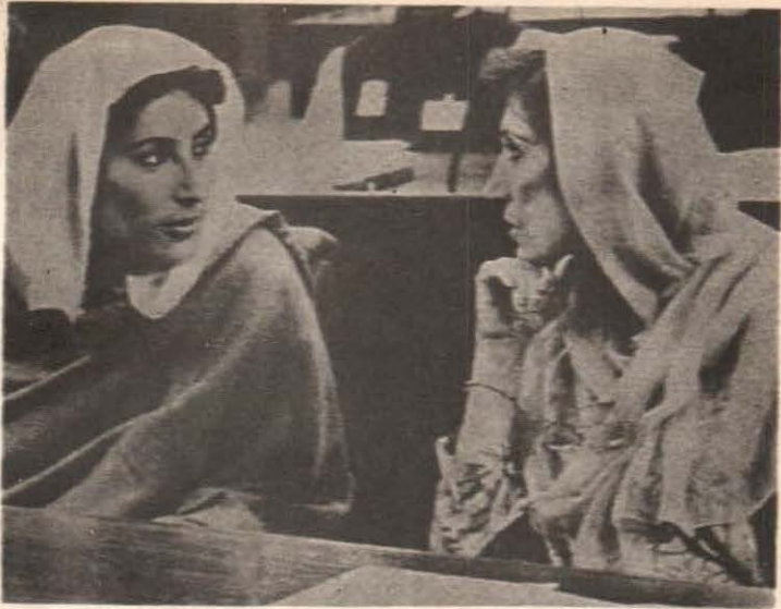
نصرت ڀٽو ۽ بينظير ڀٽو قومي اسيمبليءَ جي گڏجاڻيءَ ۾