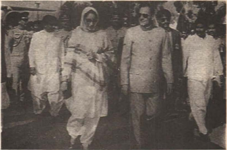
ڏکڻ ايشيا جي ٻن اهم سياسي گهراڻن جا پونيئر: بينظير ڀٽو ۽ راجيو گانڌي گڏ