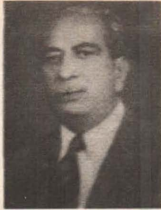
سر شاهنواز پٽو، ذوالفقار علي پٽي جو والد ۽ سياسي گهراڻي جو بنياد وجهندڙ