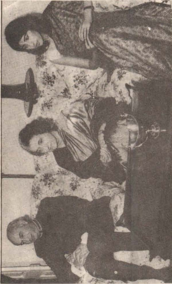
ذڪڻ ايشيا جون ٽي اهم سياسي شخصيتون: شهيد ذوالفقار علي ڀٽو، انڊرا گانڌي ۽ بينظير ڀٽو