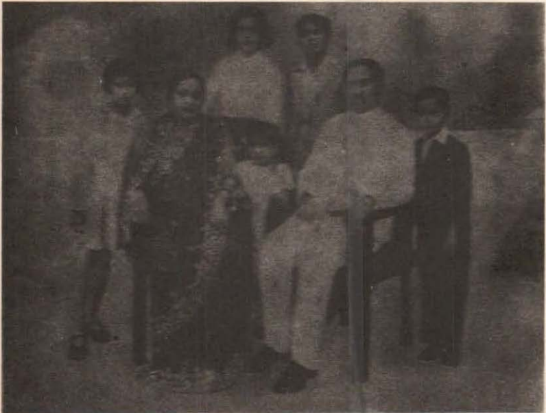
پٽي جا والدين پنهنجي ٻارڙن سان گڏ. ذوالفقار علي پٽو ساڄي پاسي ۽ کاٻي پاسي بيٺل سندس پيڻ بينظير پٽو