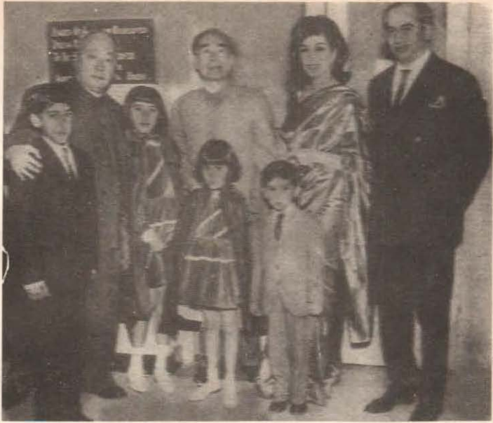
ذوالفقار علي ڀٽو، سندس ڪٽنب ۽ ٻين جو مکيه اڳواڻ چو اين لائي