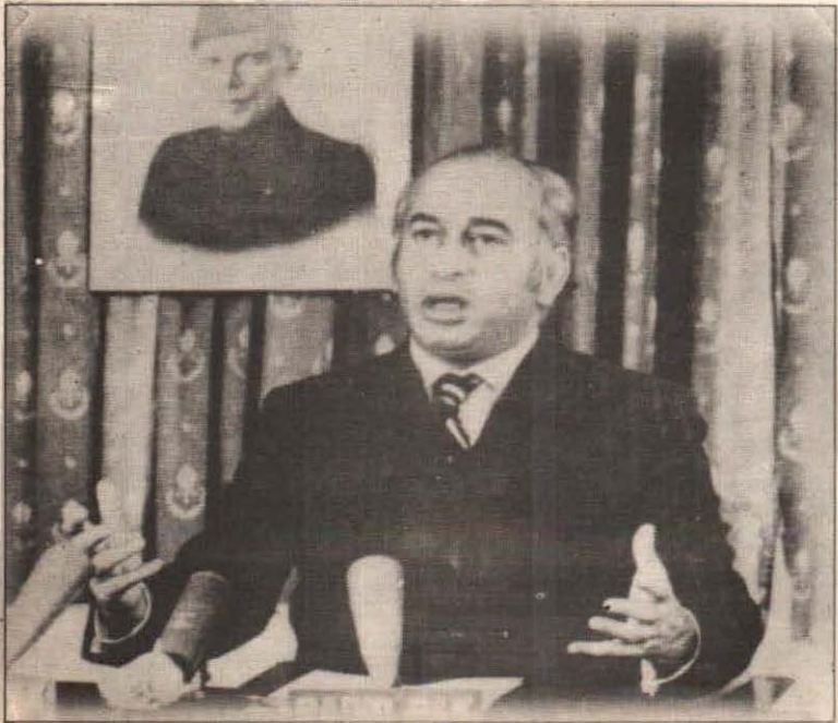
ذوالفقار علي ڀٽو 1971ع ۾ چونڊيل صدر طور قوم کي خطاب ڪندي