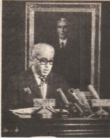
ذوالفقار علي ڀٽو چونڊيل وزيراعظم طور قسم کڻندي