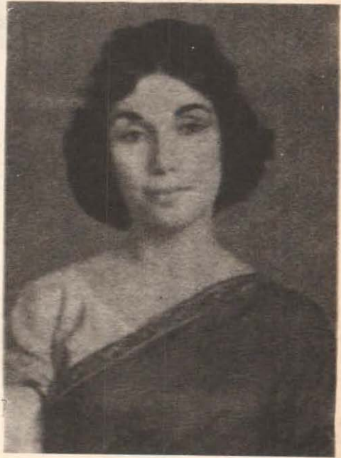
پہ من موہیندر شخصیتون: ذوالفقار علي ڀٽو ۽ بيگم نصرت ڀٽو